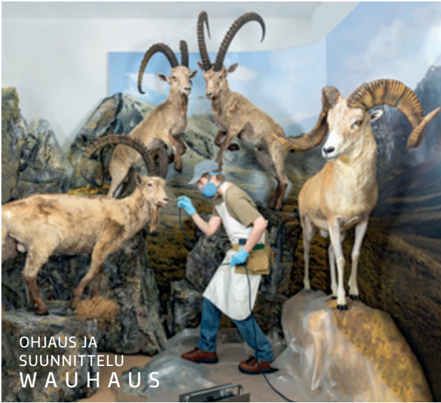
OHJAUS JA SUUNNITTELU WAUHAUS